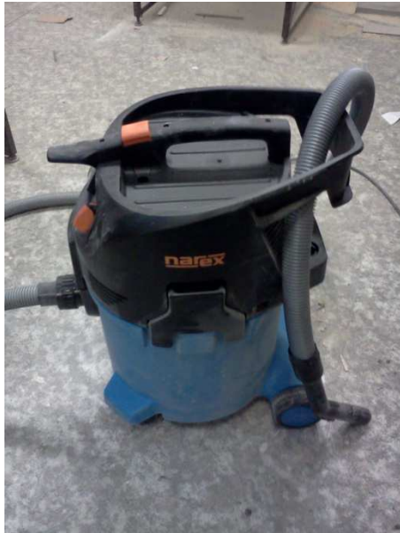
Dílenský vysavač s průchozí zásuvkou a automatickým startem