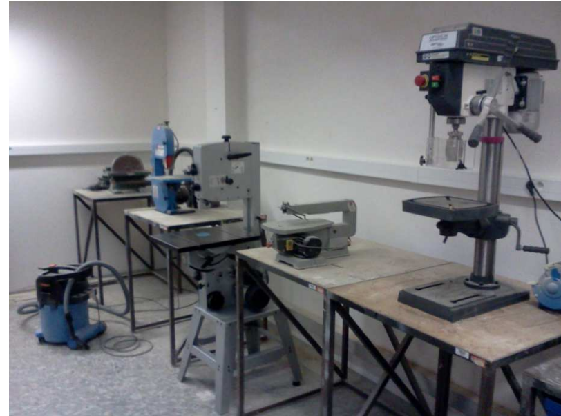
Rozvody elektrických zásuvek pro připojení stávajícího a nového vybavení