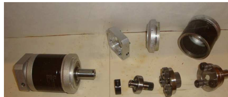
Sady strojních dílů