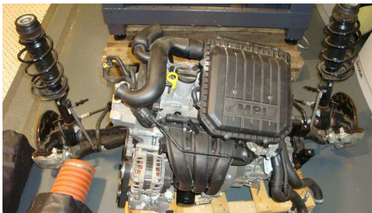
Automobilový agregát s převodovkou